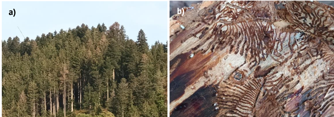
Abb. 3: (a) Kupferstecher-Befall in einem älteren Bestand erkennt man am besten vom Gegenhang, da zunächst meist nur die obersten Kronenteile betroffen sind; (b) Brutbild des Kupferstechers: die Brut befindet sich im Larvenstadium und wird sich bis zum Winter winterhart entwickeln können

sind zwar im Vergleich zu Buchdruckern das „kleinere“ Übel (im doppelten Sinn), auch sie können aber flächigen Primärbefall verursachen (vor allem in schwächeren Beständen und Jungwuchs). Nicht zuletzt bereiten sie dem Buchdrucker das Feld, wenn sie an älteren Fichten zunächst die Krone befallen und den Baum damit entscheidend schwächen. Buchdrucker-Befall folgt dann oft etwas zeitverzögert am restlichen Stamm.